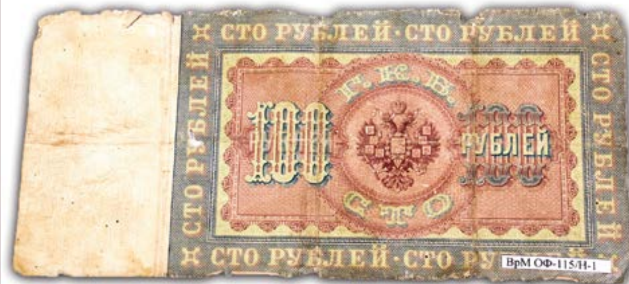
Государственный кредитный билет образца 1898 года достоинством 100 рублей. Датировка: Конец XIX века. Материал: бумага. Техника: печать. Размеры: 12 см. х 25,9 см.