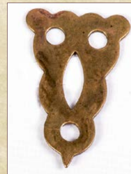
Украшение медное литое. Материал: медь. Размеры: длина 5,2 см, ширина 3,4 см.