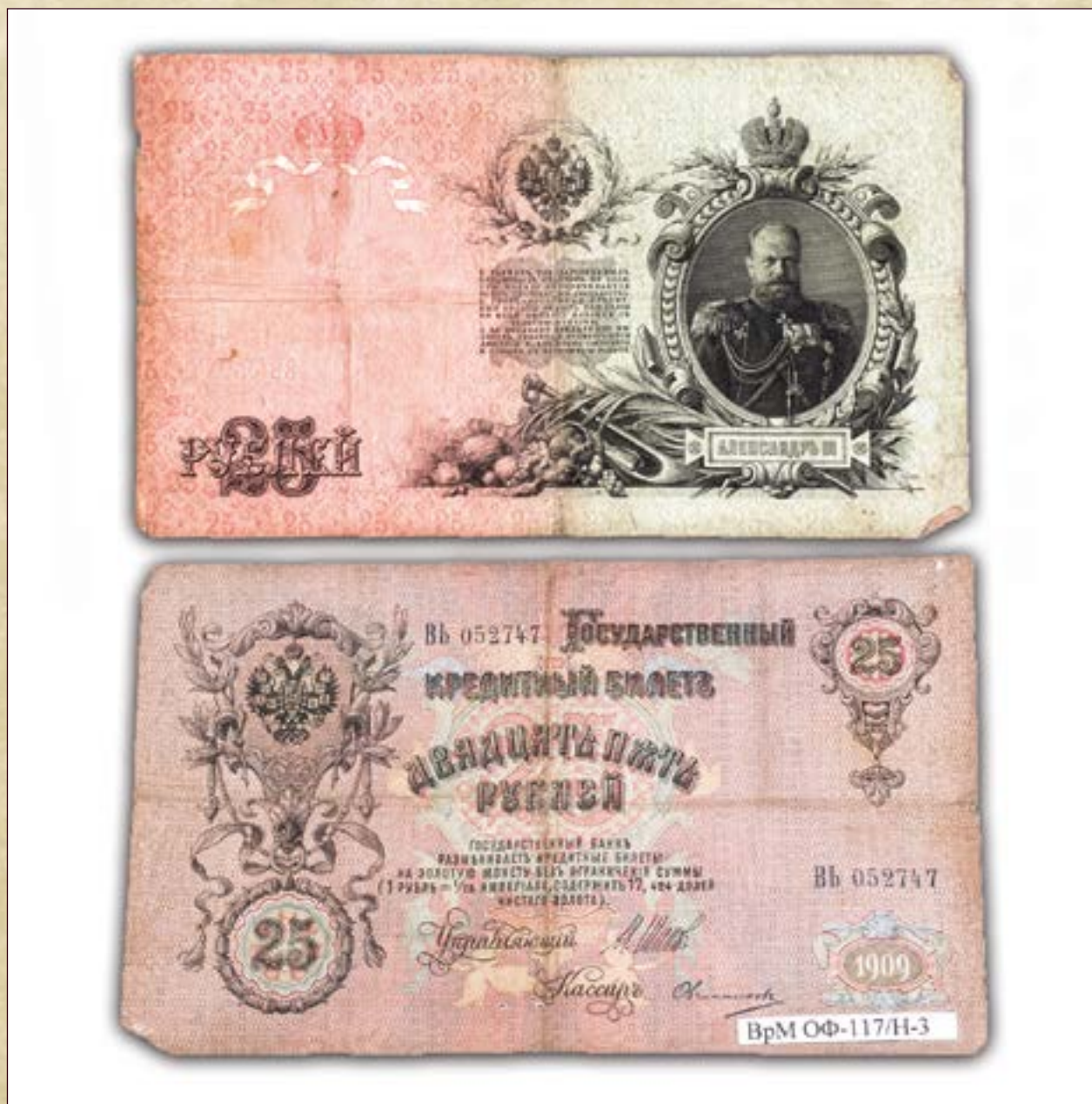
Государственный кредитный билет образца 1909 года достоинством 25 рублей. Датировка: Начало XX века. Материал: бумага. Техника: печать. Размеры: 10,7 см. x 17,6 см.