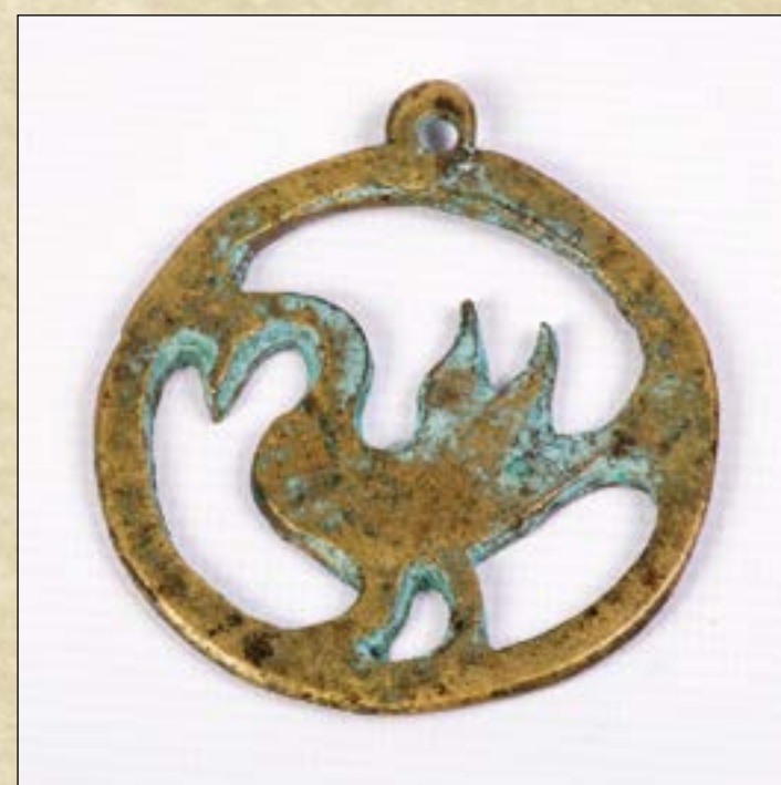
Приклад. Подвеска медная. Материал: медь. Размеры: диаметр 7 см.