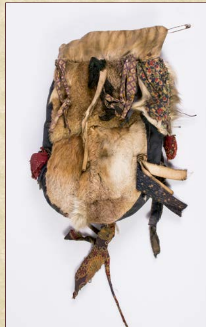
Сумка для рукодельных принадлежностей.