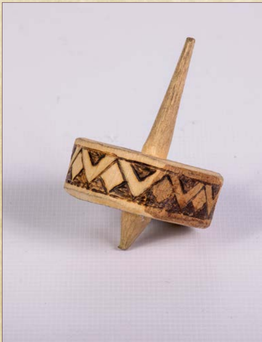
Игрушка деревянная «Юла». Датировка: Начало XXI века. Место создания: ХМАО - Югра, Нижневартовский р-н, с. Варьёган. Материал: дерево. Ручное производство. Размеры: Диаметр 4,2 см., толщина 1,5 см., длина палочки 6,5 см.