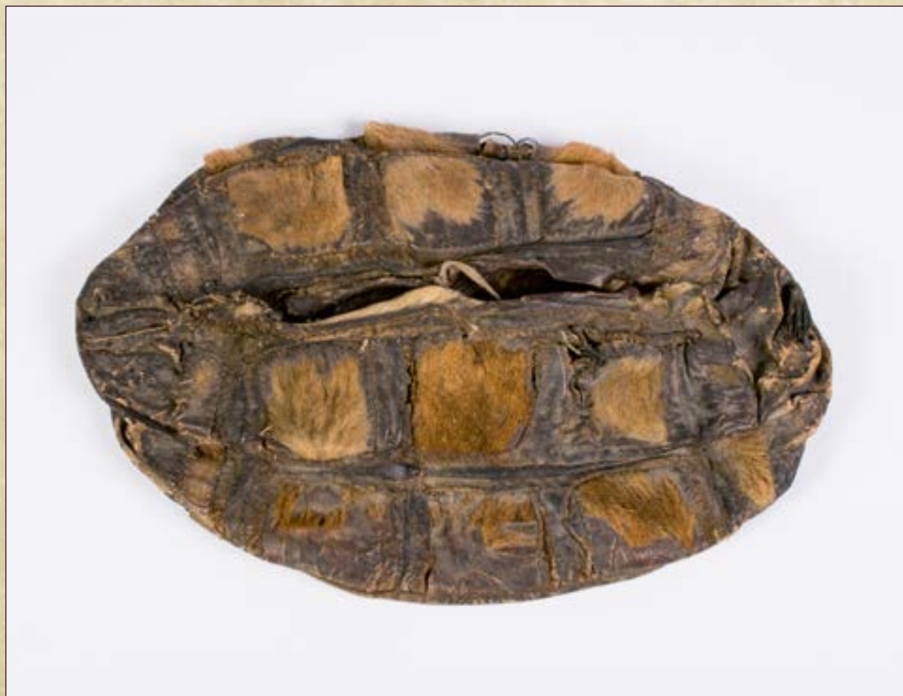
Мешочек женский для хранения рукодельных принадлежностей.