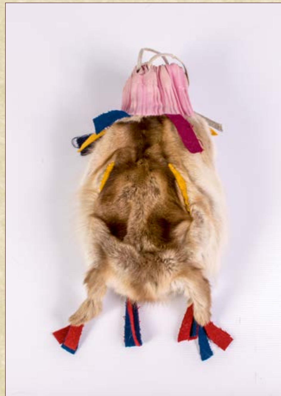
Женский мешочек для хранения рукодельных принадлежностей.