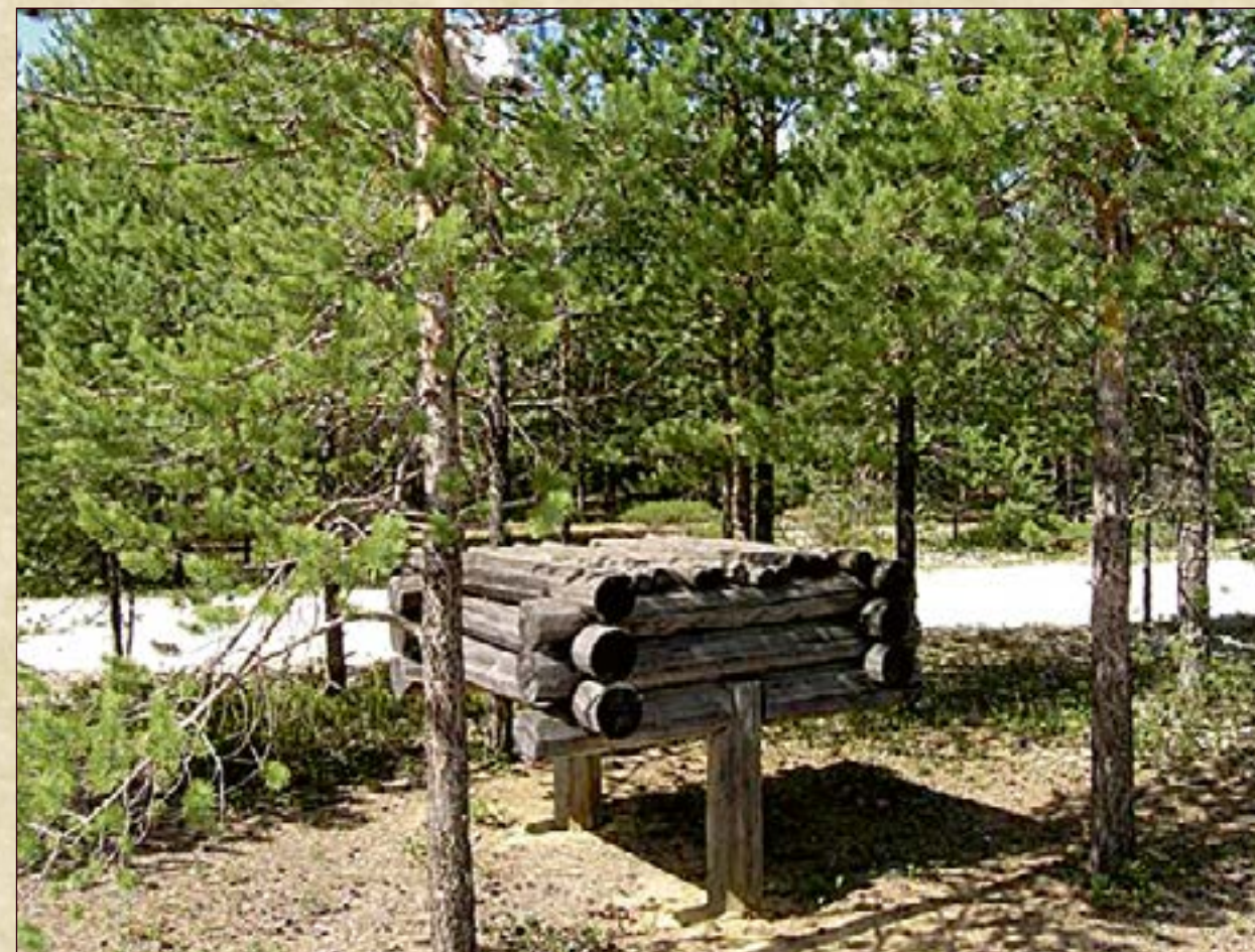
Хранилище для медвежьих костей. Изготовитель: Айпин С.А. Датировка: Конец XX века. Место создания: ХМАО - Югра, Нижневартовский р-н, с. Варьёган. Материал: дерево. Ручное производство. Размеры: Длина 175 см., ширина 173 см., общая высота 140 см. Высота сруба 60 см., высота ножки 80 см.