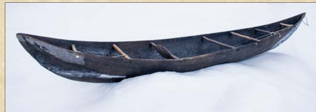
Облас. Национальное наименование: Ай рыт. Датировка: Вторая половина XX века. Место создания: ХМАО - Югра, Нижневартовский р-н, с. Варьёган. Материал: дерево. Ручное производство. Размеры: Длина 339,5 см., ширина 61 см., высота 29,5 см.