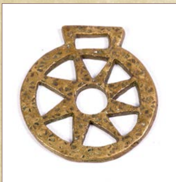
Приклад. Подвеска медная. Материал: медь. Размеры: диаметр 6,9 см.