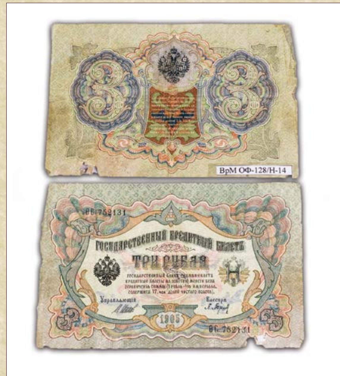
Государственный кредитный билет образца 1905 года достоинством 3 рубля. Датировка: Начало XX века. Материал: бумага. Техника: печать. Размеры: 9,5 см. x 15 см.