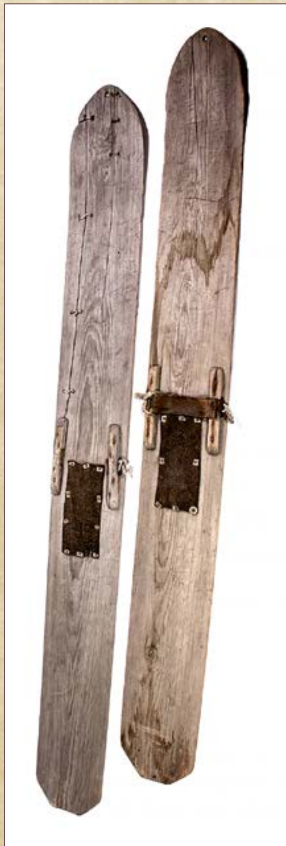
Лыжи деревянные женские. Датировка: Вторая половина XX века. Место создания: ХМАО - Югра, Нижневартовский р-н, с. Варьёган. Материал: дерево, металл (гвозди), войлок, нить капроновая, алюминий. Ручное производство. Размеры: длина 159 см., ширина 17,5 см., толщина 0,5 см.