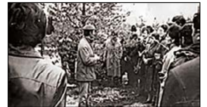
Первая экскурсия 1987г.