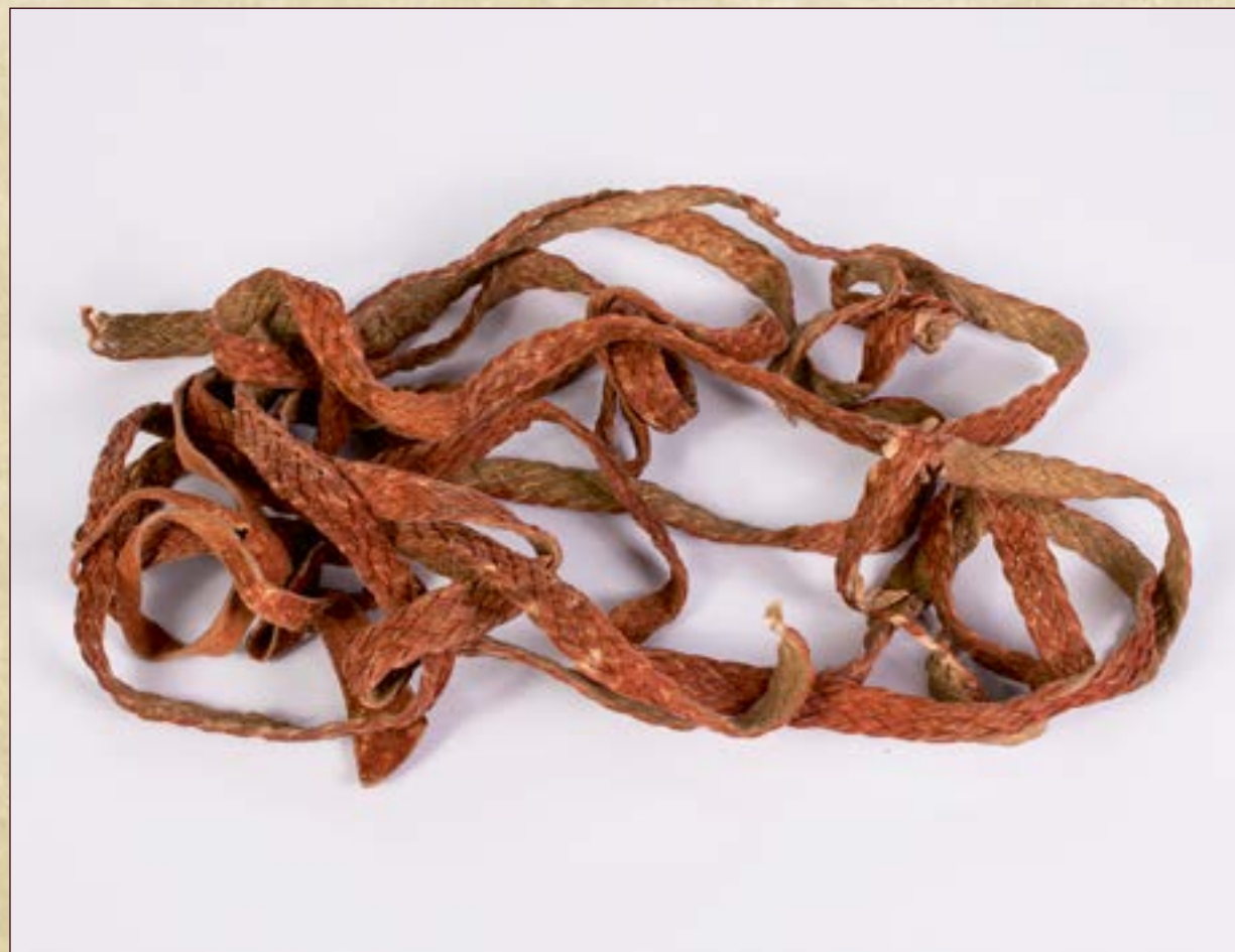
Веревка праздничная, элемент оленьей упряжи. Датировка: Последняя четверть XX века. Материал: кожа оленья (выкрашена в красный цвет). Техника: плетение, выделка кожи.