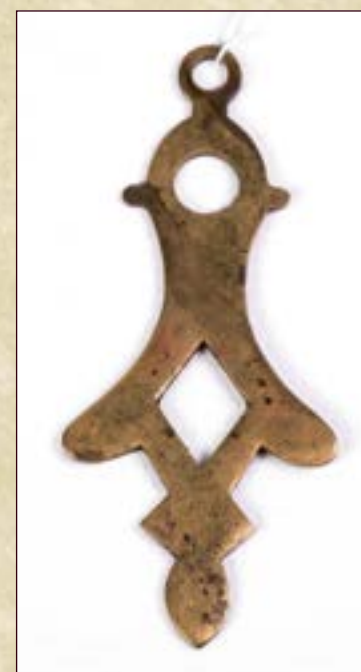
Украшение медное литое. Материал: медь. Размеры: длина с петлей 7,7 см, ширина 3,4 см, диаметр петли 0,5 см.