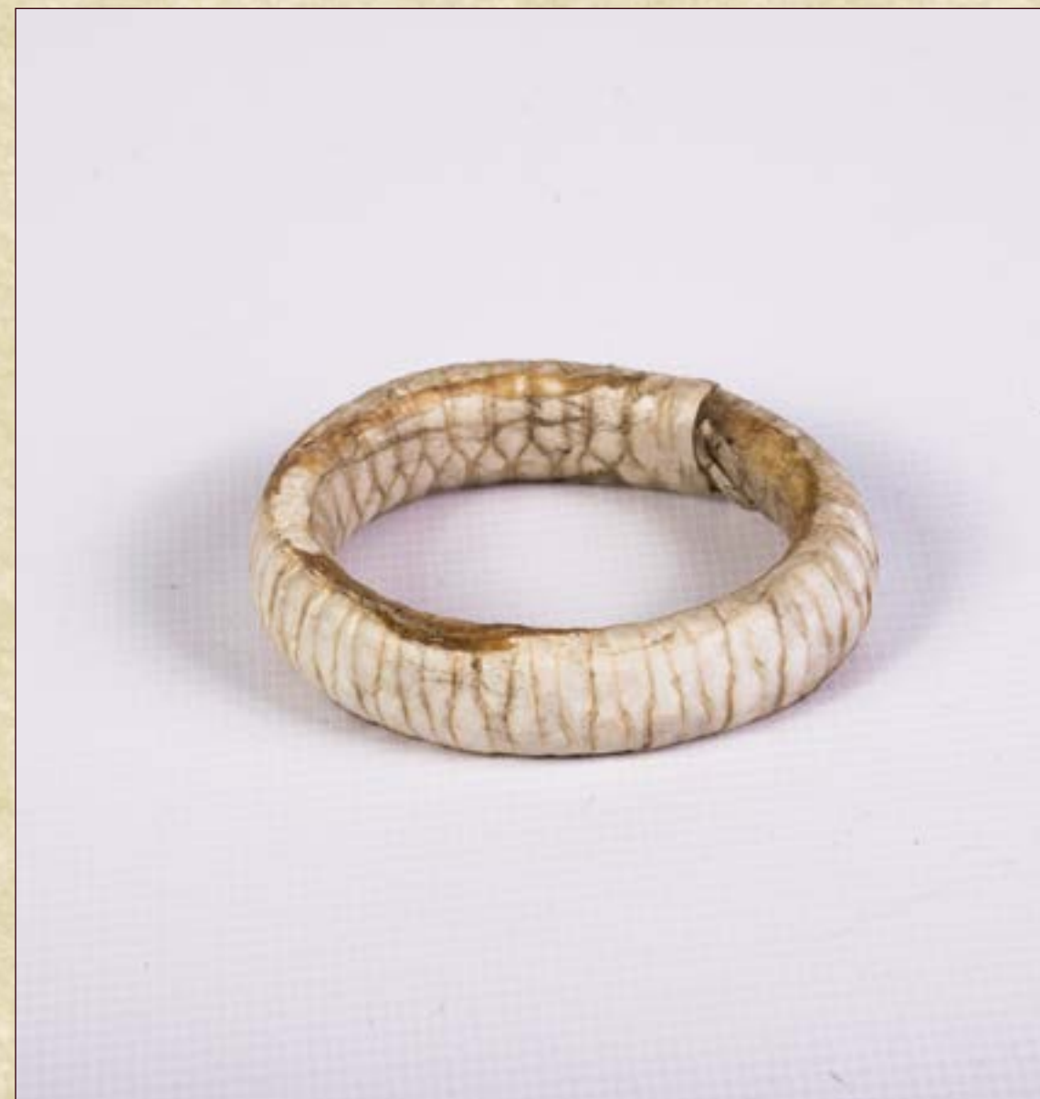
Погремушка. Место создания: ХМАО - Югра, Нижневартовский р-н, с. Варьёган. Материал: трахея птицы, дробь. Ручное производство.