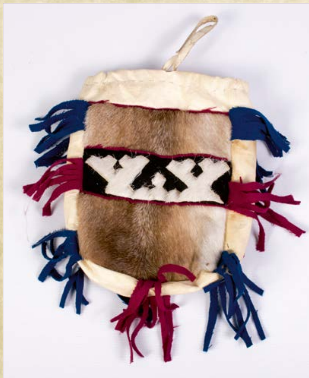
Мешочек для охотничьих принадлежностей.