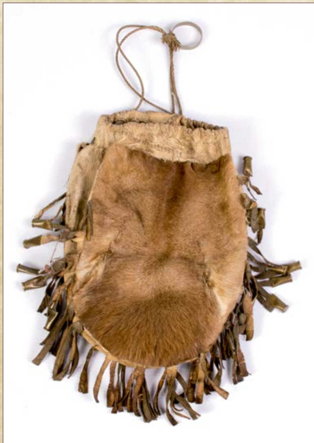
Мешочек для хранения швейных принадлежностей. (украшение из патрончиков). Материал: кожа, металл, ровдуга. Ручное производство.