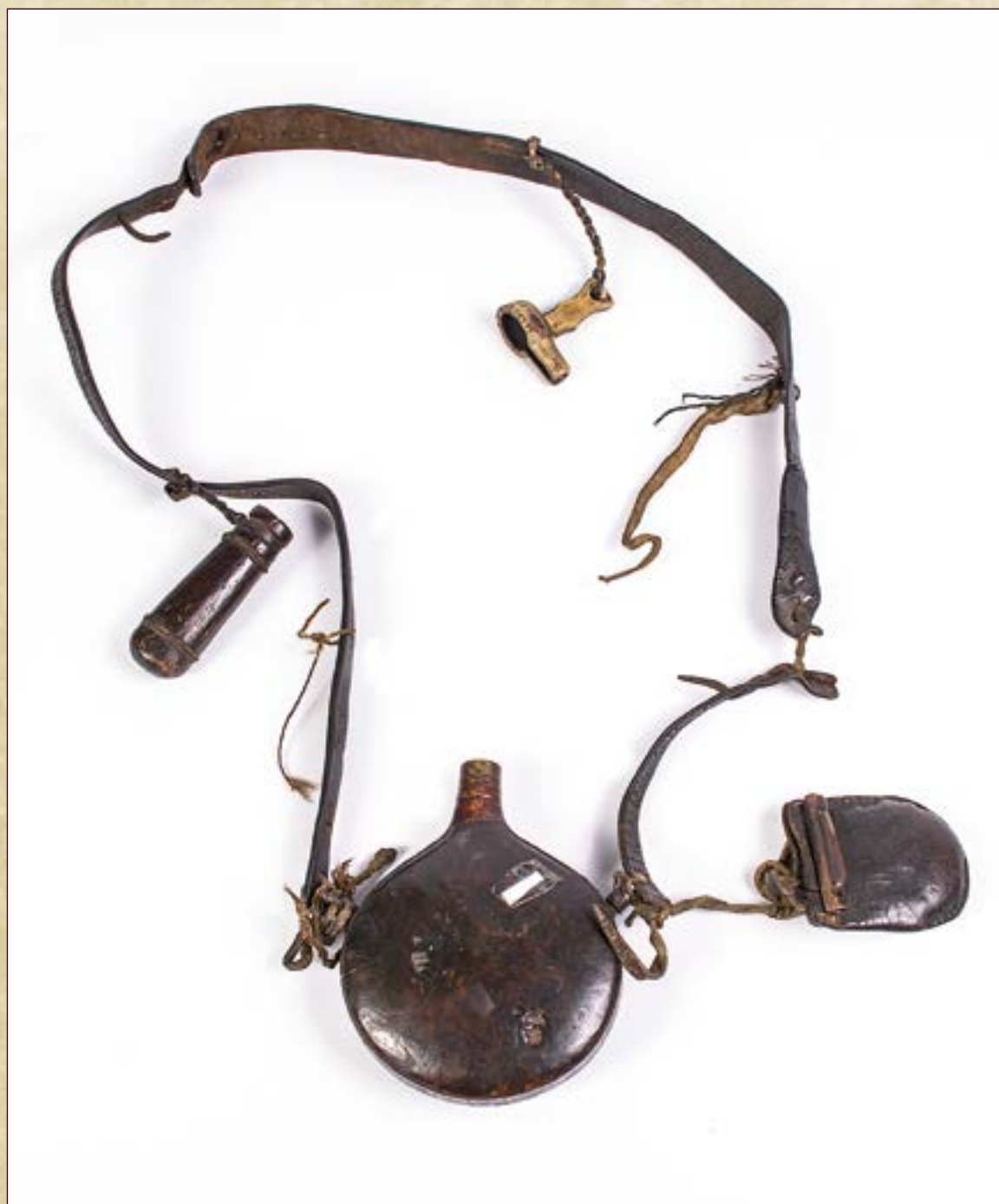
Пояс мужской охотничий с пороховницей, меркой для измерения пороха и мешочком для дробы.