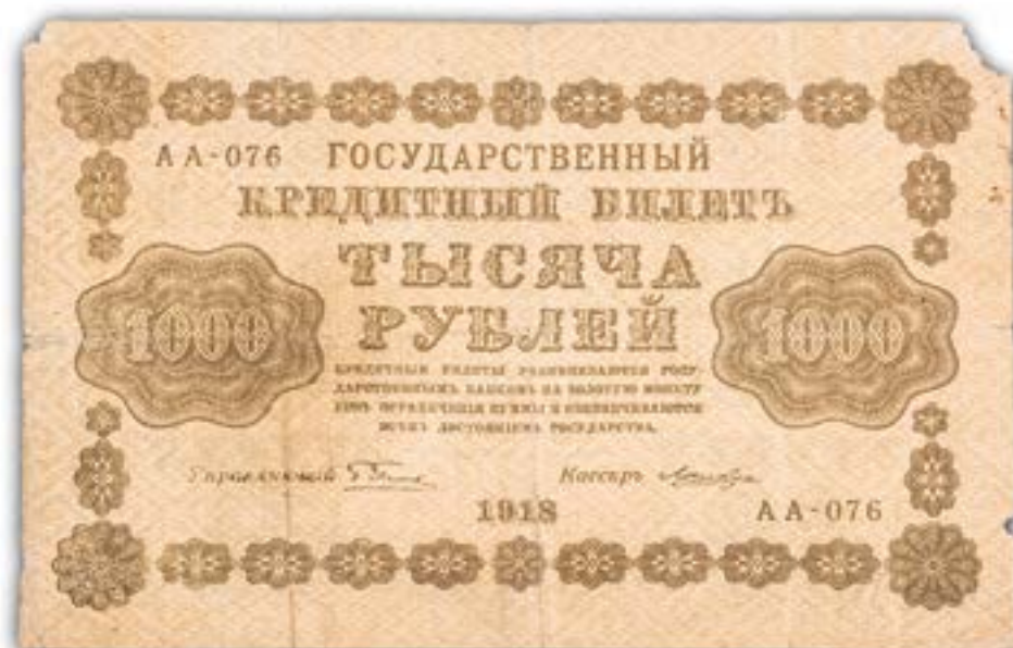
Государственный кредитный билет 1000 рублей АА-076 1918г. Материал: бумага. Размеры: 15,9 см. х 10,9 см.