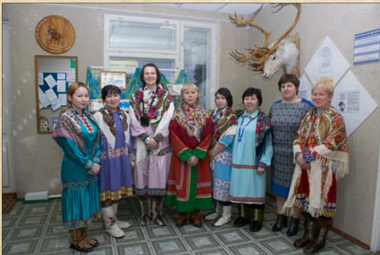
Ханты-Мансийский автономный округ – Югра Нижневартовский район село Варьёган. ул. Айваседа Мэру, д. 20 Тел. +7 (952) 721 01 00 E-mail: museum-varegan@mail.ru https://www.museum-varegan.com