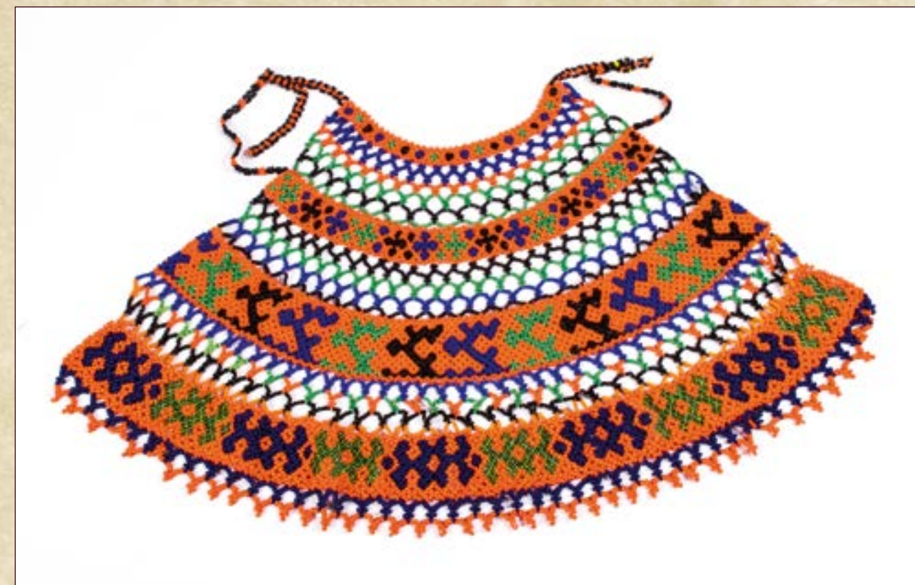
Украшение нагрудное. Изготовитель: неизвестен. Датировка: Начало XXI века. Место создания: ХМАО - Югра, Нижневартовский р-н, с. Варьёган. Ручное производство. Материал: бисер, леска.