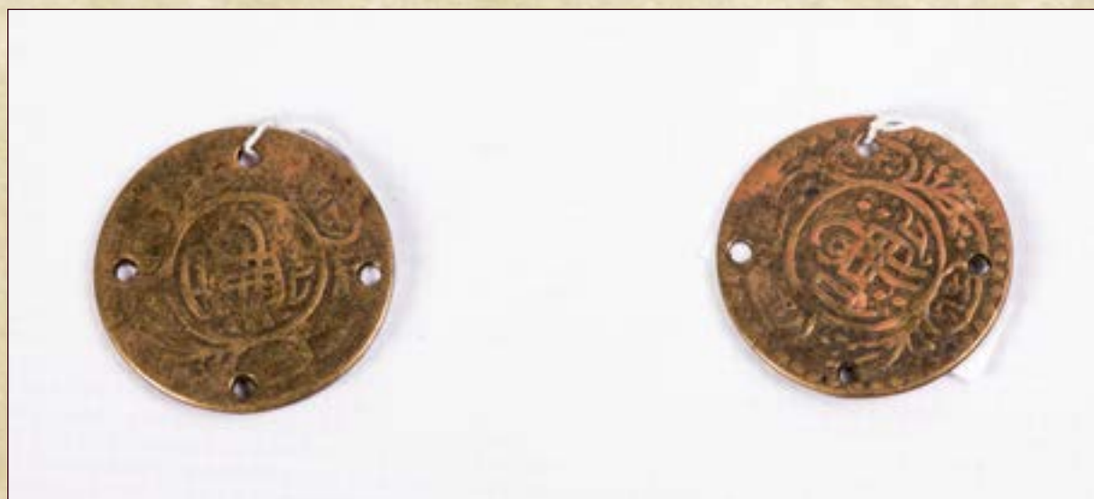
Накладка медная тонкая. Материал: медь. Размеры: диаметр 2,6 см, толщина 1 мм.